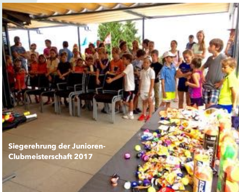
Siegerehrung der Junioren- Clubmeisterschaft 2017

PS: Wir wissen um eure knappe und kostbare Zeit © Das vorliegende Lob und Lobs ist daher eine etwas abgespeckte Nummer.